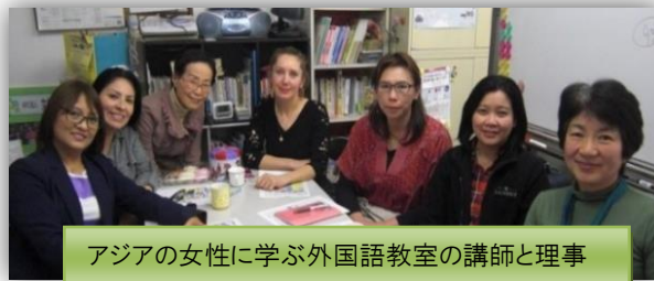
アジアの女性に学ぶ外国語教室の講師と理事